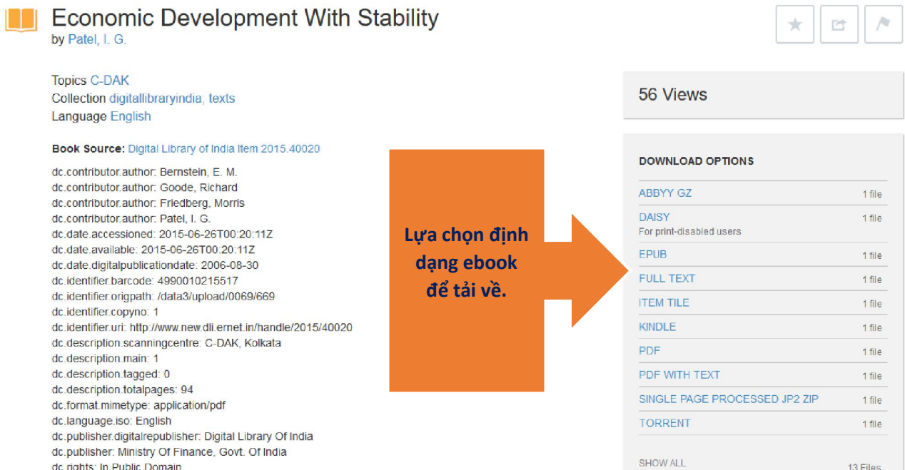
Hình 3: Thông tin mô tả tài liệu trên Internet Archive